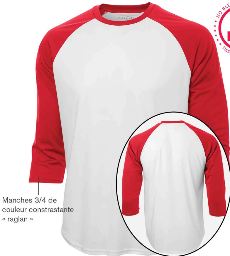
Manches 3/4 de couleur contrastante « raglan »